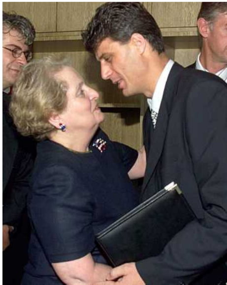
Madeline Albright (secretaria de Estado de EE.UU.) y Hashim Thaci (Líder de la UCK), agosto 1999, después de la guerra