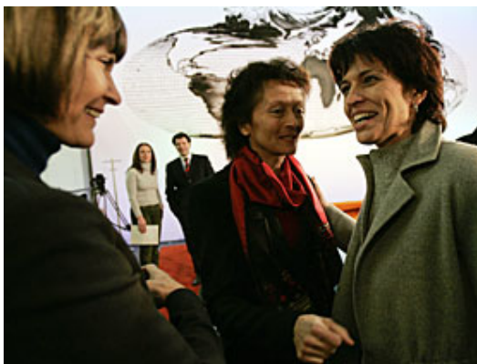
Satisfacción de las ministras suizas, Micheline Calmy-Rey (izq), Eveline Widmer-Schlumpf (centro) y Doris Leuthard (decha).

Los suizos votaron este domingo a favor de que las puertas al mercado laboral sigan abiertas entre la Unión Europea y Suiza, y que este camino se extienda para Bulgaria y Rumania.