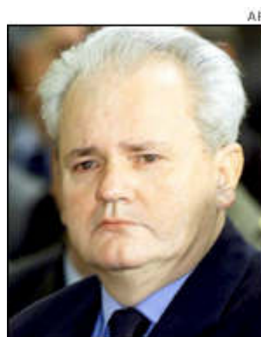
Slobodan Milosevic

El fin del régimen de Milosevic incluyó hasta una agresión militar de la OTAN en 1999, pero a pesar de lo compleja de la situación en la ex Yugoslavia, de lo fragmentada que estaba la sociedad, ni con eso consiguieron la derrota del líder socialista, por lo que tras la suspensión de los bombardeos se inició el sutil proceso de subversión, las elecciones a la presidencia de la federación fueron el detonante de la crisis.