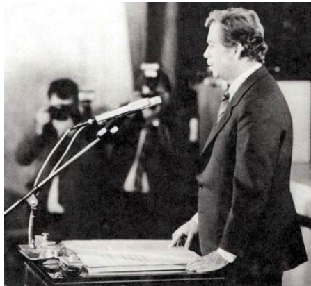
29-12-1989 Václav Havel elegido presidente de Checoslovaquia

Hurgando en la historia de los “procesos de colores”, podemos asegurar que todos han tenido signo contrarrevolucionario, reaccionario, monocromático, siendo el primero el que se realizó en Praga, la capital de la entonces Checoslovaquia en 1989, cuando cerca de 200.000 personas se manifestaron contra las autoridades a las que acusaban de provocar actos de violencia policial 3 y pedían reformas de todo tipo enarbolando consignas a favor de la “libertad” y de la “democracia”.