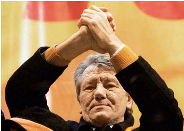
Víctor Yúshenko y la Revolución Naranja

En un proceso, que se convirtió en el corolario de la Revolución Naranja, Yúshenko alcanzó la victoria con el 52% de los votos, al tiempo que Yanukovich conseguía solo 44,2%.