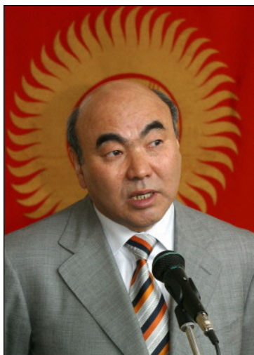
Askar Akayev.

El colapso se produjo y el experimento se repitió en marzo de 2005 en Bishkek, la capital del lejano Kirguizistán. Nuevamente las manifestaciones y los enfrentamientos siguieron a los comicios en los que los resultados no favorecieron a los opositores y el pretexto del inicio de las acciones fue oponerse a las pretensiones de Akayev de perpetuarse en el poder.