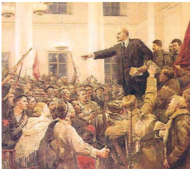
Lenin tenía otra idea sobre el socialismo

Lenin murió en enero de 1924 profundamente preocupado por las deformaciones burocráticas del joven Estado soviético. Lo que se construyó al final en la URSS distaba mucho de las ideas planteadas por Lenin en "El Estado y la Revolución". El Estado soviético no llegó nunca a ser transformado realmente y eso se apreció, con mucha claridad en las relaciones del centro con la periferia, especialmente en su relación con los pueblos de Asia Central.