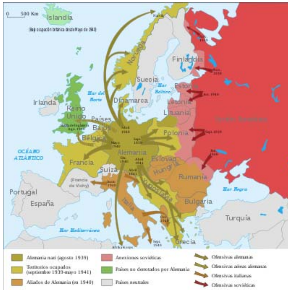
Mapa donde se observa el cumplimiento por parte de la Alemania fascista y la URSS de lo negociado en el "Pacto Ribbentrop-Mólotov"

Pilares insustituibles de un orden internacional justo y equilibrado, que coinciden perfectamente con la política exterior leninista. En el caso soviético, una vez desaparecido el líder bolchevique estas prácticas fueron abandonadas y lo que se hizo, muchas veces, fue contrario a esto. Sólo así se explican las guerras en las que se involucró la URSS desde 1939 de la que, claro está, excluimos la Gran Guerra Patria contra la agresión fascista.