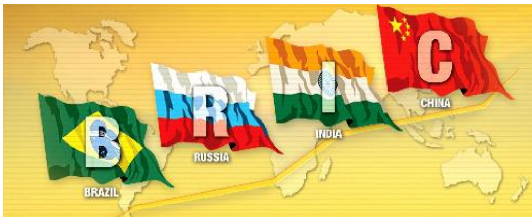
Los países del BRIC se adelantan sobre los Estados Unidos

El empantanamiento y la virtual derrota militar que están sufriendo en Irak constituyó el punto de inflexión que demostró que el súper poder de EEUU emprendía su acelerado declive hegemónico. La reemergencia de Rusia, con presupuestos diferentes al Híper liberal que la llevó al caos, la aparición del grupo BRIC y la OCS, y el avance de la izquierda, más organizada y mejor estructurada, en América Latina son señales nada deleznales.