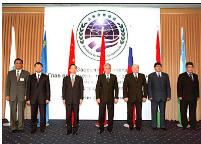
La Organización de Cooperación de Shanghai está integrada actualmente por China, Kazajstán, Kirguisistán, Rusia, Tadjikistán y Uzbekistán.

Esto se acordó cuatro meses antes del 11 de septiembre de 2001 que luego sirviera de detonante a los norteamericanos para desatar su "Guerra contra el Terrorismo". Concordaron además reunirse anualmente al más alto nivel de Jefes de Estado para pasar revista al cumplimiento de estos compromisos.