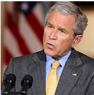
Según Bush, el G20 debe establecer bases para la reforma financiera

La gravedad de esta crisis dio lugar a que líderes de diferentes países estén reclamando una reforma para establecer una nueva arquitectura del sistema financiero internacional. El presidente de Francia, Nicolás Sarkozy, a la vanguardia de esta iniciativa, ha manifestado que "ésta es una crisis mundial y debemos encontrar una solución mundial" imprescindible para que el sistema financiero del mundo globalizado pueda estar mejor supervisado y reconstruir un capitalismo "que sea mas respetuoso del ser humano, mas respetuoso del planeta, mas respetuoso de las futuras generaciones, y acabar con el capitalismo obsesionado con la búsqueda frenética de ganancias a corto plazo".